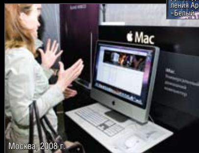
Москва, 2008 г.

В общем, вечеринка удалась даже при том условии, что число пришедших на нее оказалось в несколько раз меньше расчетного количества человек (по-видимому, сказала «рабочая» суббота). Только вот... с гордостью можем отметить, что еще два года тому назад нашему белорусскому AppleTeam удалось подготовить и провести не менее грандиозное мероприятие, но с меньшими затратами и, кажется, большей пользой... МК