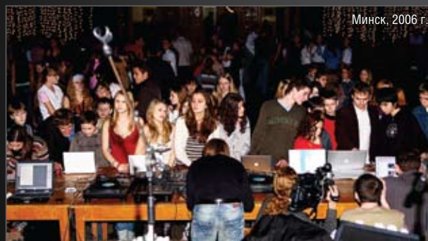
Минск, 2006 г.

Однако одним лишь общением дело не ограничилось: организаторы для малознакомых, но горящих желанием приобщиться к «яблочной» культуре посетителей включили в программу несколько познавательных мастер-классов